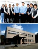
池田建設工業株式会社従業員みなさん。

高松 池田建設工業株式会社 設立 1967年 資本金 200万円 従業員数 95名 経営 ICT推進