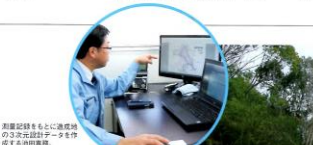
業務提携のもとに連携したICT活用による業務効率化の推進。

池田建設工業株式会社は、高松市に本社を置く、建設機械のリース・販売・保守・修理を主とする会社です。創業は1967年、現在は従業員95名、資本金200万円です。ICT推進を掲げ、最新の技術を取り入れることで、お客様の課題を解決し、信頼関係を築いていくことを目指しています。